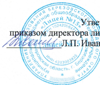
ГРАФИК работы Комиссии по контролю за организацией питания в муниципальном бюджетном общеобразовательном учреждении «Лицей №15» на 1 полугодие 2022-2023 учебный год