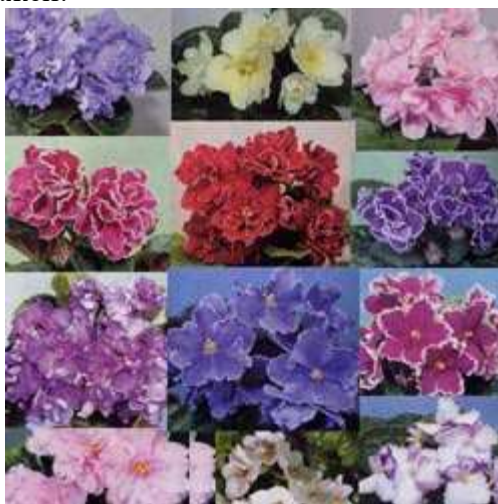
Рисунок 19. Коллаж, выполненный с помощью прямоугольного выделения.