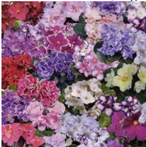
Рисунок 21. Коллаж, выполненный с помощью выделения от руки (лассо).