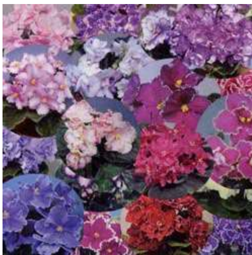
Рисунок 20. Коллаж, выполненный с помощью кругового выделения.