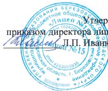
ГРАФИК работы Комиссии по контролю за организацией питания в муниципальном бюджетном общеобразовательном учреждении «Лицей №15» на 1 полугодие 2023-2024 учебный год