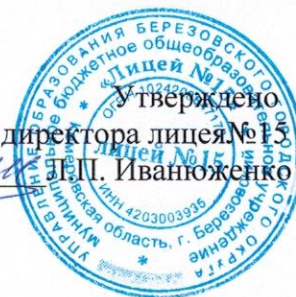
ГРАФИК работы Комиссии по контролю за организацией питания в муниципальном бюджетном общеобразовательном учреждении «Лицей №15» на 2 полугодие 2023-2024 учебный год