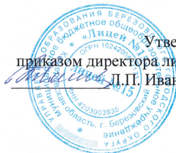
ГРАФИК работы Комиссии по контролю за организацией питания в муниципальном бюджетном общеобразовательном учреждении «Лицей №15» на 2 полугодие 2021-2022 учебный год